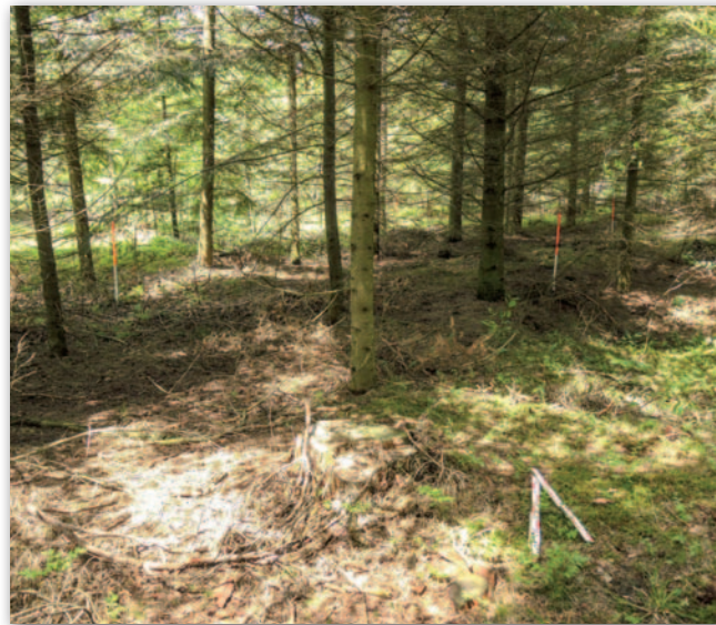
Rys. 1. Przykład słabej widoczności (czytelności) obiektu zabytkowego w terenie zalesionym

Rys. 2. Przekrój przez chmurę punktów – część centralna teren zalesiony. A – chmura punktów ulegająca redukcji w procesie klasyfikacji w celu utworzenia NMT; B – chmura punktów odpowiadająca powierzchni terenu jako podstawa NMT